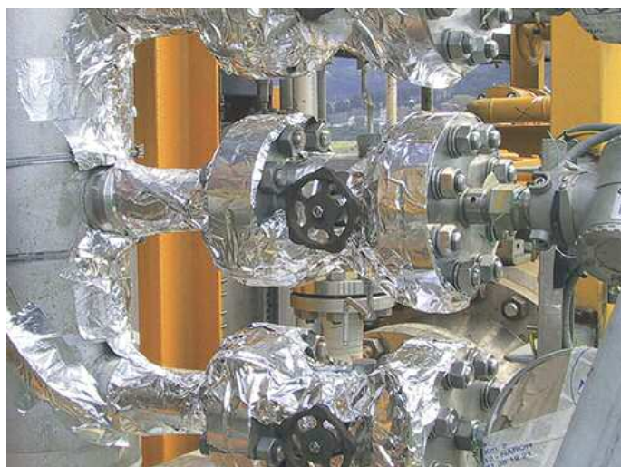
Cobrimento do tracejado com isolamento