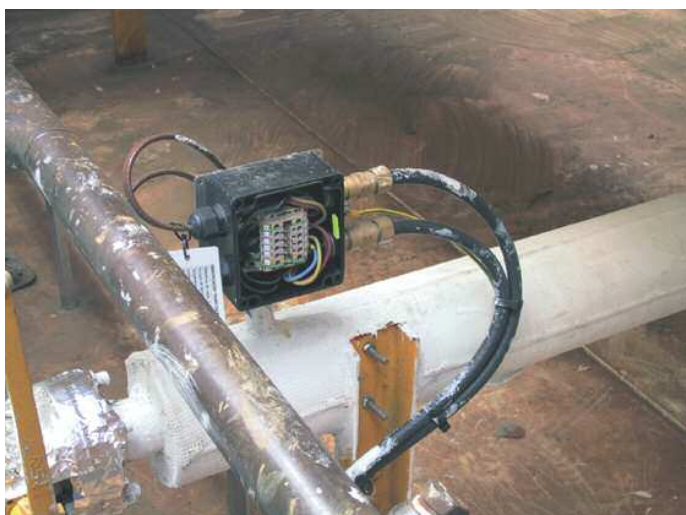
Caixa conexão para o controlo do tracejado