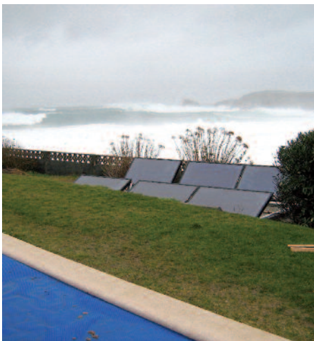
Instalação solar térmica de 12m 2 de superfície de captação para ACS, apoio ao aquecimento e climatização de piscina em Meirás (Valdoviño)