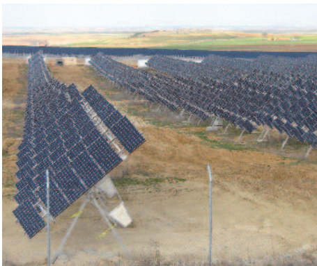
2,1 MW sobre seguidores em Peleas de Abajo (Zamora)

posta em marcha, trâmites legais e administrativos e manutenção preventiva e corretivo. Desde o ano 2004 temos instalado mais de 5 MW de potência em diferentes instalações fotovoltaicas, repartidas por todo o território nacional.