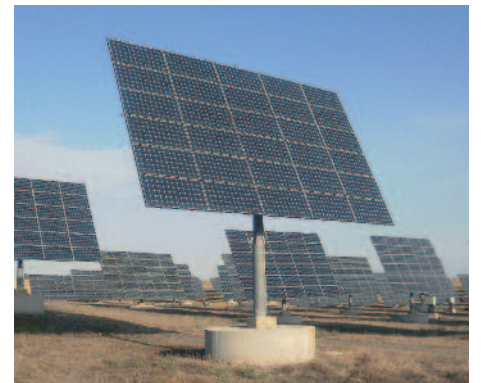
800 kW sobre seguidores em Villanueva do Duque (Córdoba)