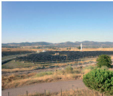
1,7 MW sobre terreno em estrutura fixa em Peñarroyo-Pueblonuevo (Córdoba)