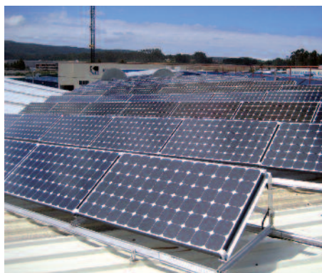
23,52 kW sobre coberta de nave em Narón (A Corunha)