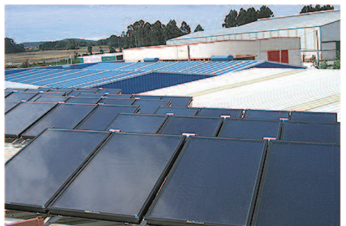
Instalação de 96m 2 de superfície de captação para climatização solar com máquinas de absorção em Narón (A Coruña)