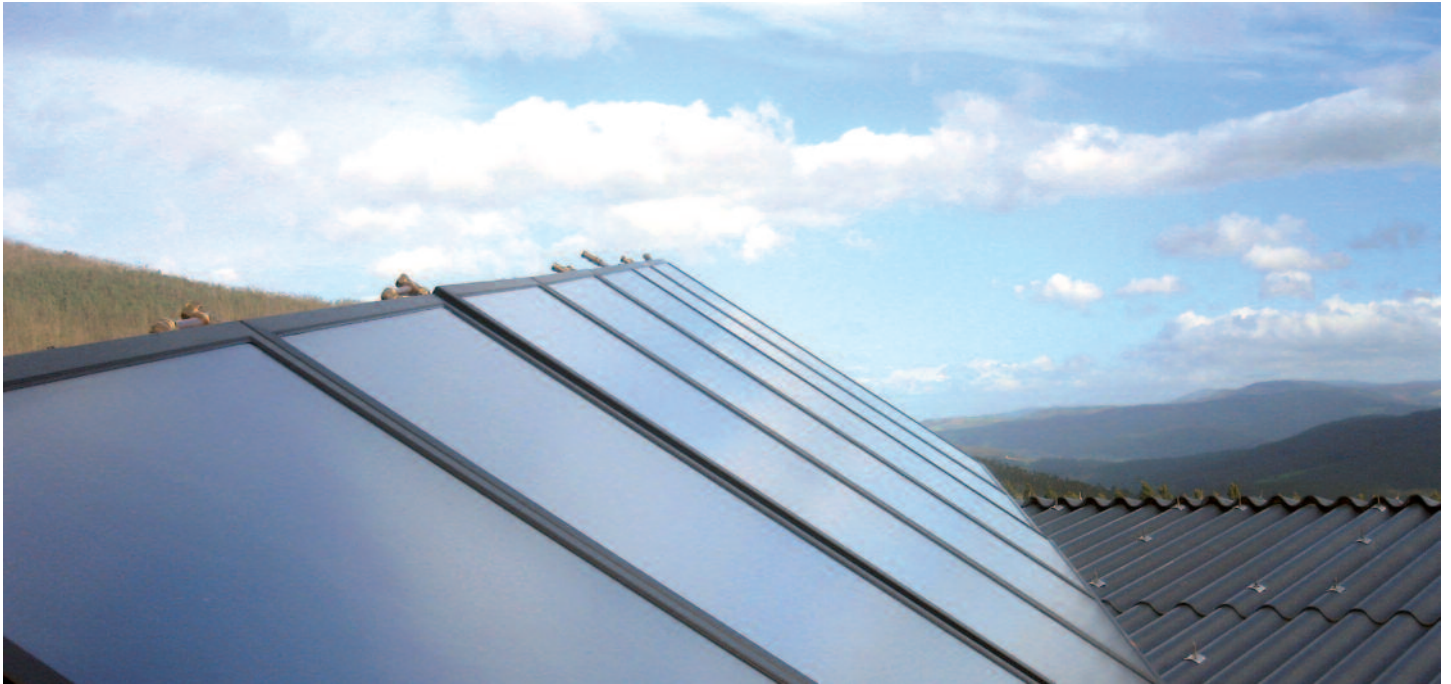
Instalação solar térmica de 32m 2 de superfície de captação para ACS em Ribadeo (Lugo)