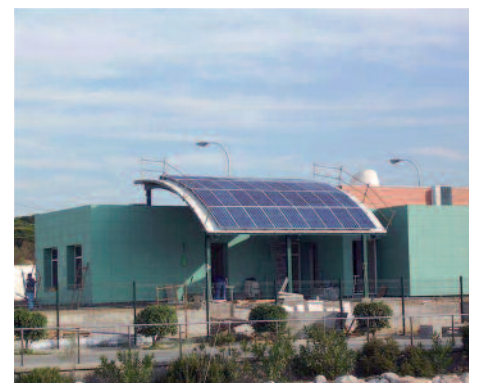
6,12 kW sobre coberta curvada no Ponto de informação do Parque Natural La Breña e Marismas em Barbate (Cádiz)