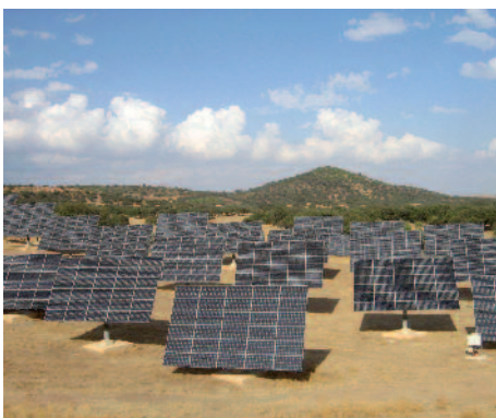
400 kW sobre seguidores de Alosno (Huelva)