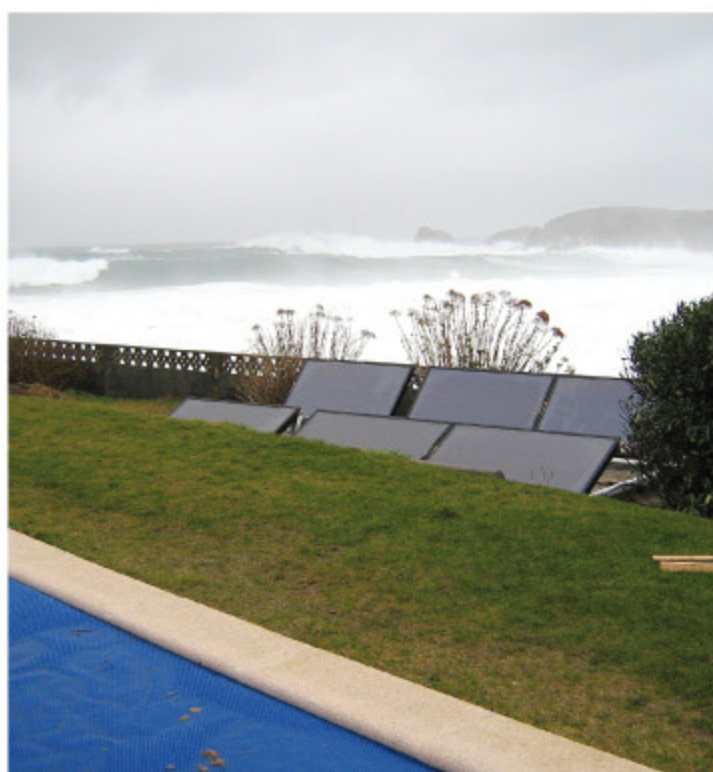
Instalación solar térmica de 12m 2 de superficie de captación para ACS, apoyo a calefacción y climatización de piscina en Meirás (Valdoviño)