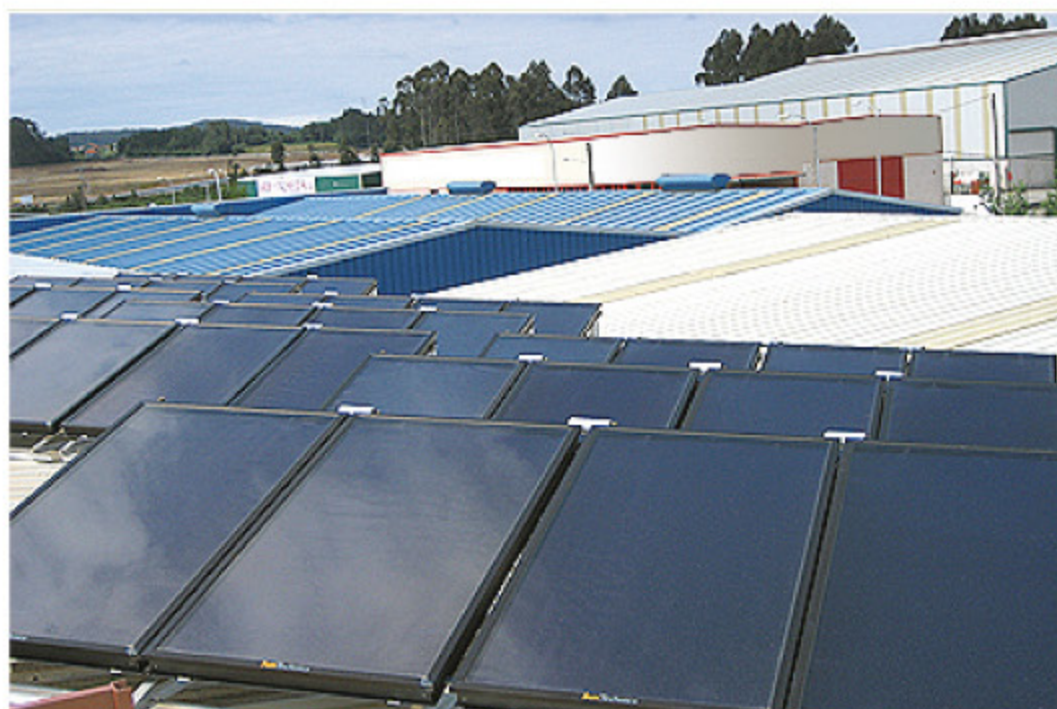
Instalación de 96m 2 de superficie de captación para climatización solar con máquinas de absorción en Narón (A Coruña)